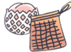
みかん・タマネギなどを 保護するネット