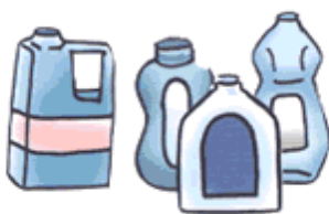
洗剤・シャンプーなどの容器 ※キャップやふたは 外してください。