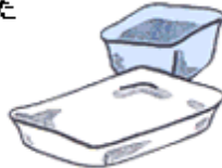
食品などのトレイ