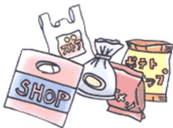
ポリ袋・商品包装など