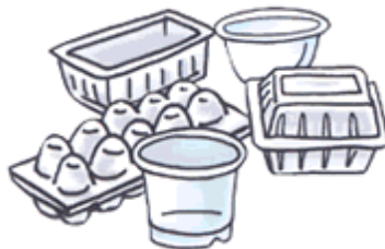
カップ・パック類